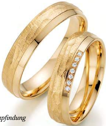
15 - Empfindung