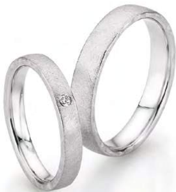
10 - Wohlvollen