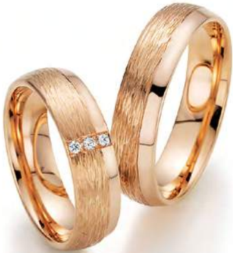
3 - Bestimmung