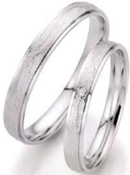
5 - Anbeginn