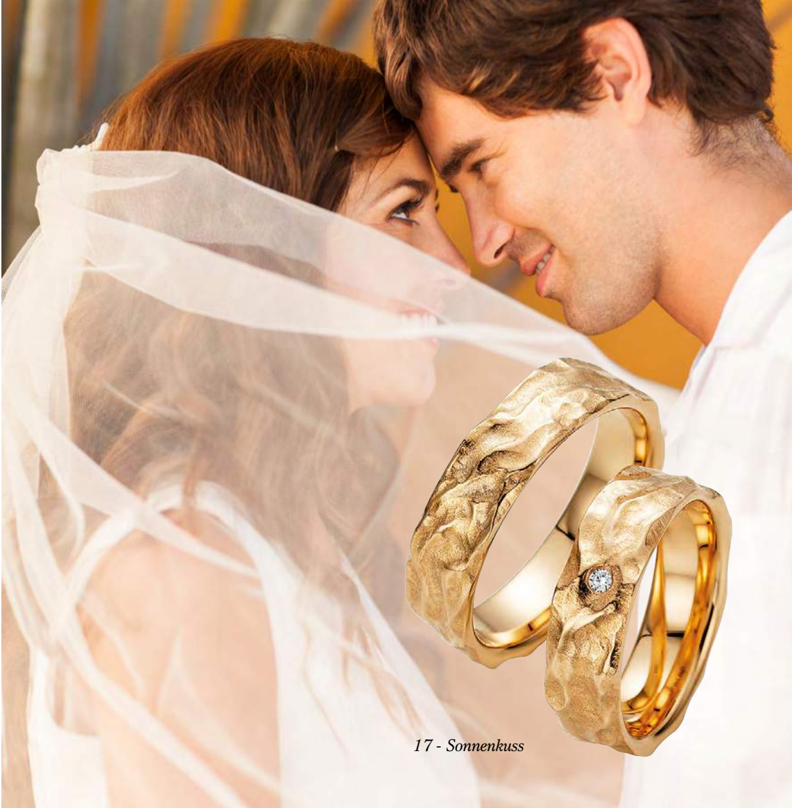
17 - Sonnenkuss