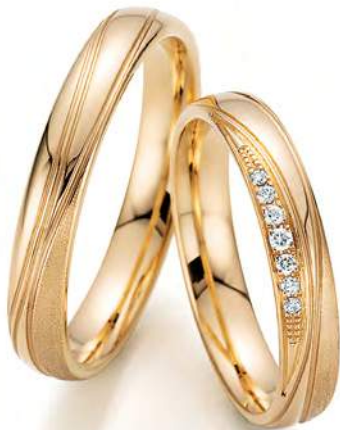
19 - Poesie