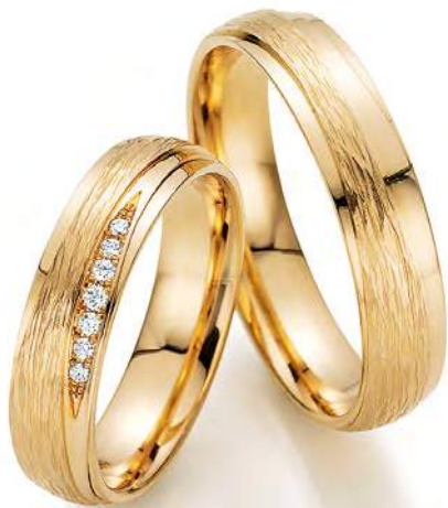
18 - Antlitz