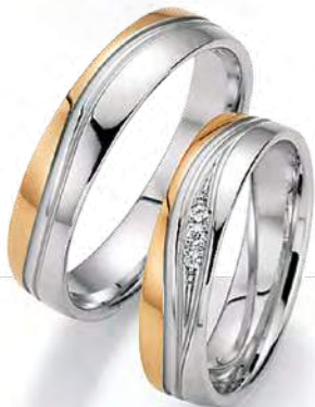
12 - Verehrung