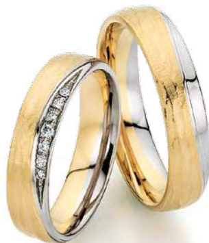
13 - Sonnenbote