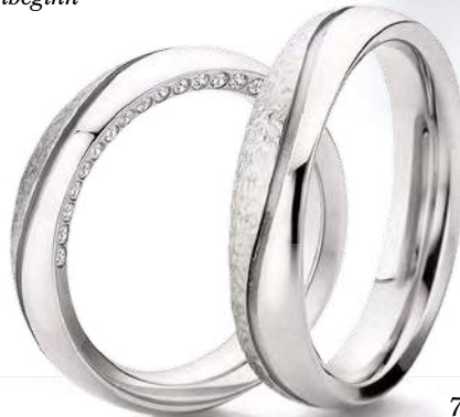
7 - Bewusstsein

Stilvoll designte Oberflächen sind ein traditionelles Merkmal vieler Fischer Trauringe. Unsere Modelle zeigen eindrucksvoll, welche Handwerkskunst erfahrene Goldschmiede täglich ausüben.