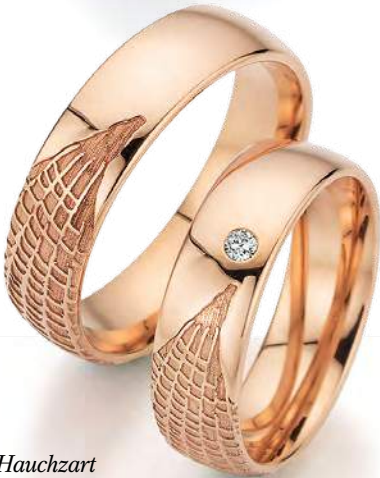
4 - Hauchzart