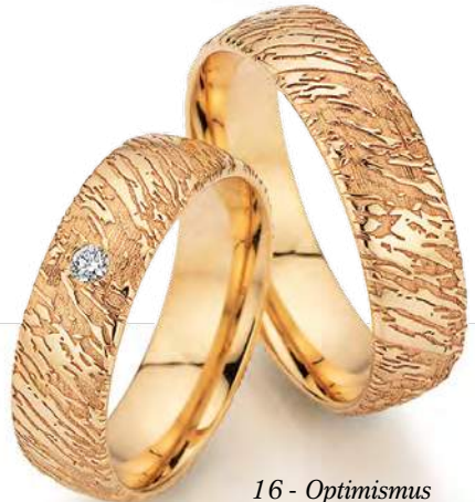
16 - Optimismus