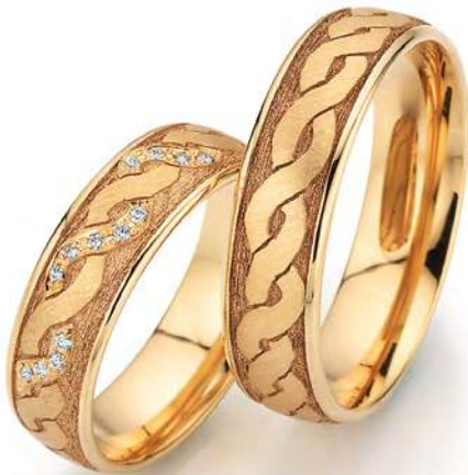
20 - Symbolkraft