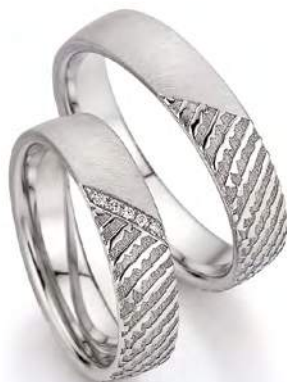
11 - Neugier