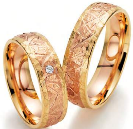
21 - Leuchtkraft