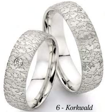
6 - Korkwald