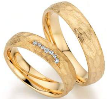
14 - Morgensonne

Das Außergewöhnliche daran: Die warme Farbnuance passt wunderbar zu jedem Teint! Ob heller, mittlerer oder eher dunkler Hauttyp, Apricotgold gilt als wahrer Hautschmeichler und bringt die Haut zum Strahlen.